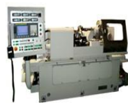
電解ロール研削盤