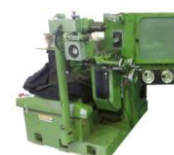
プロファイル研削盤